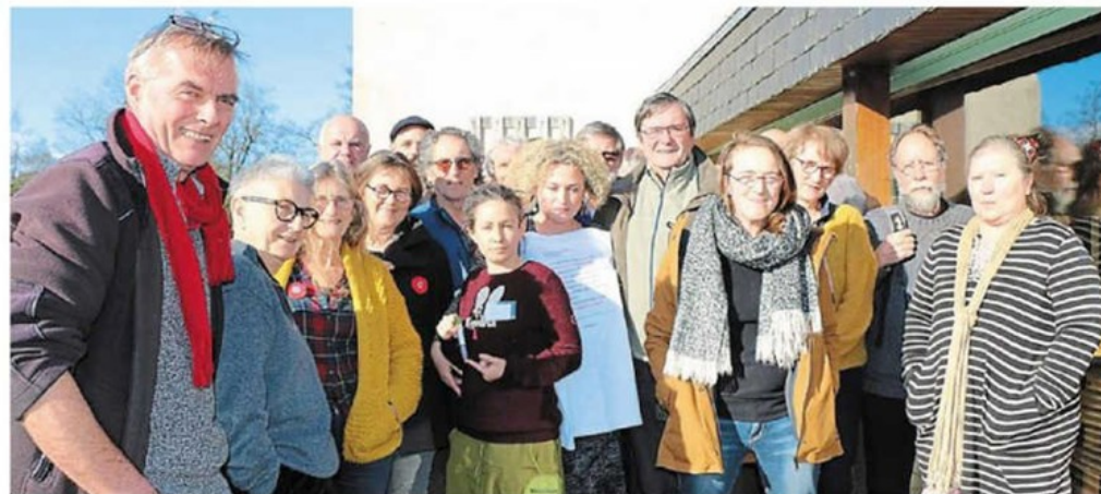
Les Pisseurs involontaires de glyphosate de Bretagne se sont réunis pour une grande campagne de prélèvements d'urines. Objectif : interdire les pesticides.

Aujourd'hui, ces militants veulent se servir de ces tests urinaires à grande échelle pour porter plainte « pour